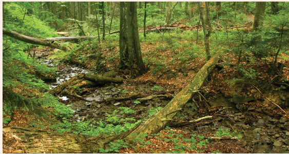
א וואלד אין די טיפע אוקראינע