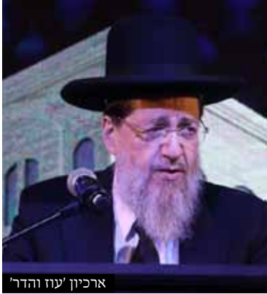
ארכיון 'עוז והדר'

שאלה: היכן ראוי לכוון בכדי לצאת ידי חובת עיקר מצוות תקיעת שופר, בתקיעות דמעומד או במיושב.