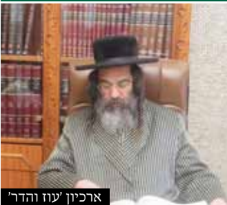
ארכיון 'עוז והדר'

הגאון רבי משה בראנדסדארפער שליט"א גאב"ד היכל הוראה ובעל שו"ת היכל הוראה