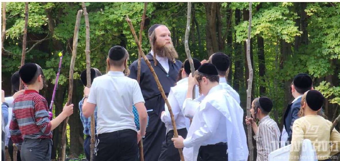
אין א שפאציר מיט די בחורים