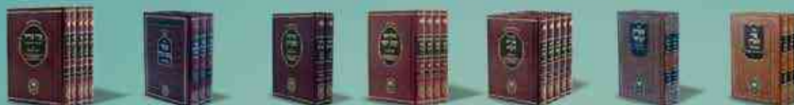
פרי הארץ עבודת ישראל תניא תולדות יעקב יוסף צדקת הצדיק בעל שם טוב פרי צדיק

מרכז הזמנות: 1800-22-55-66 ☎ ובחנויות הספרים המובחרות