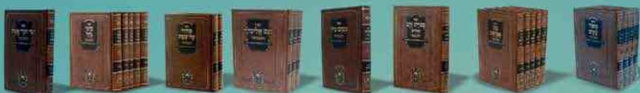
מאור עיניים מגן אברהם מעורת הזהב מנחם ציון נועם אלימלך סדרו של שבת ערבי נחל יושר דברי אמת