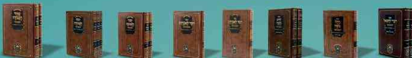
דברי יחזקאל ויחל משה חיים וחסד חסד לאברהם ראדומסק חסד לאברהם ר"א סקאליסק יסוד האמונה יסוד העבודה עמוד העבודה