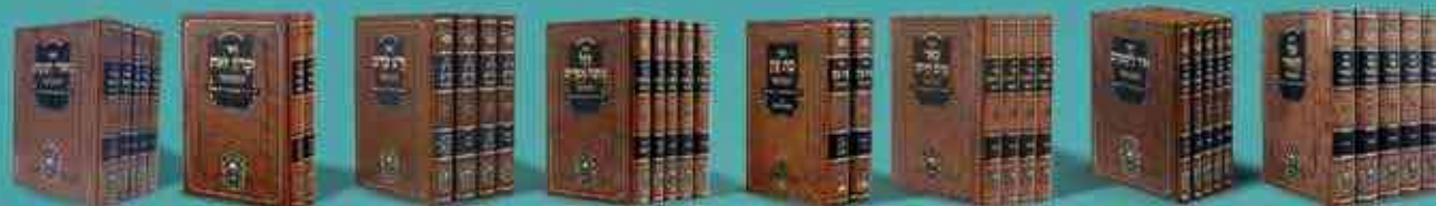
אור המאיר אור לשמים באר מים חיים בת עין דגל מחנה אפרים זרע קודש זכרון זאת מאור ושמש