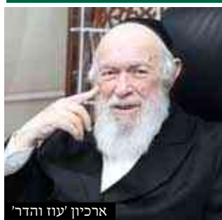
ארכיון 'עוז והדר'

וגם בישראל שבא על השפחה דהבן אינו מתייחס אחריו או עבד שבא על הישראלית דהבן אינו מתייחס אחריו, מ"מ אפשר דלא הוי יתום כיון דמ"מ יש לו אב, רק לדיני התורה לא נחשב אב אבל אינו מתשושי כח א"כ אינו בלאו זה, וצ"ע ואין נפ"מ כל כך כיון דאין לוקין על לאו זה, עכ"ל. ונראה להביא ראיה לספיקו של המנח"ח, מדברי בעל הטורים בפרשת כי תצא (דברים כד יז) שם נאמר: לא תטה משפט גר יתום, וכתב בעל הטורים גר יתום, ולא אמר גר ויתום, לומר לך גר שנתגייר קטן שנולד דמי, עכ"ל. הרי שגר הוא בכלל יתום אף לענינים אלו. ואם כן אולי אף לענין כספי צדקה, אפשר לתת לגר כסף מהקופה של היתומים למרות שיש לו אב.