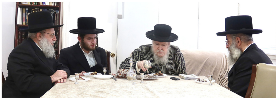
לחיים לרגל שמחת אירוסים בת הגה"צ אב"ד סאנטוב שליט"א