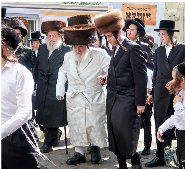
ערב יוה"כ תשפ"ה - הרבי בדרכו לעריכת השולחן