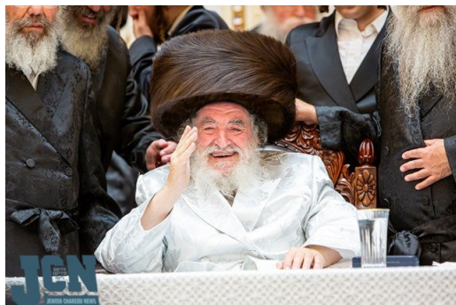
בעריכת השולחן מוצאי ראש השנה תשפ"ו