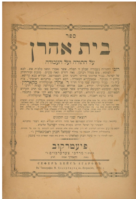
דף השער של ספר בית אהרן בו נמצא הגילוי המרעיש

שנים רבות של עמימות וחוסר וודאות אודות פרקי-התהילים הנאמרים על גבי ציון קדשו של מרן רבינו שלמה מקארלין ז"ע. רבים, מטובי הידענים ומומחי החקר, מתחבטים ואינם יודעים פתרון: אלו פרקים נקבעו לאמרם על ציונו של הקדוש רבינו שלמה, והאם בכלל תיקנו לומר פרקים כלשהם.