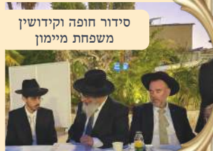
סידור חופה וקידושין משפחת מיימון