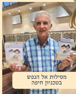
מסילות אל הנפש בטכניון חיפה