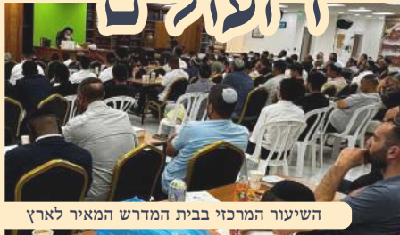
השיעור המרכזי בבית המדרש המאירי לארץ