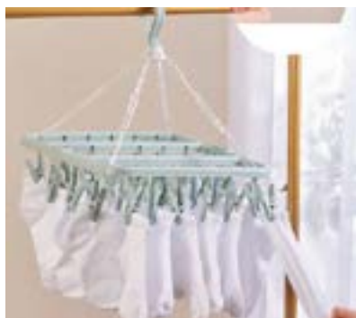
קולב לתליית גרביים