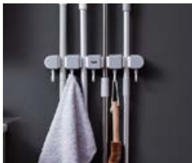
מתקן לתליית מטאטא ומגב