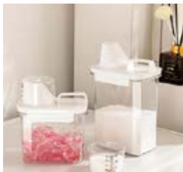
כלי לאחסון אבקת כביסה