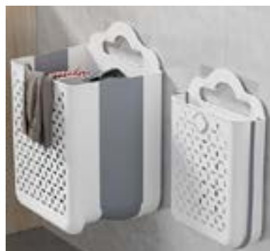
סל כביסה תלוי על הקיר ומתקן