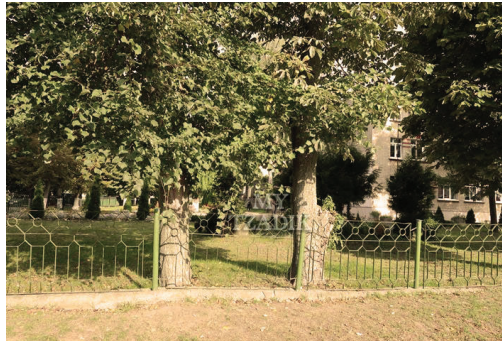
מקום קבורת קדשו של הרה"ק רבי אשר מסטאלין זצוק"ל בעיר קארלין, הנמצא כיום במקומו מוצבת גדר של גן מקומי