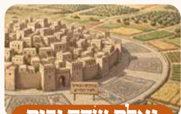
גְּאֻלַּת שְׂדֵה וּבֵית

מקדיש שדה אחוזה מקדיש שדה מקנה מקדיש שדה בערי הלויים